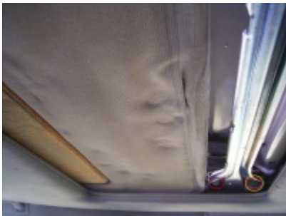
☞ 2. Bild

Nun könnt ihr das Dach von außen einfach herausheben.