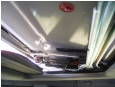
☞ 1. Bild

Diese ist mit den beiden rot eingekreisten Schrauben befestigt und ist an den beiden "Armen" jeweils mit einem Segerring gesichert.