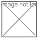
Explosionszeichnung Front, 4/5-Zylinder-Version